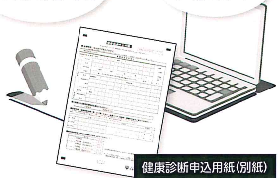
健康診断申込用紙(別紙)